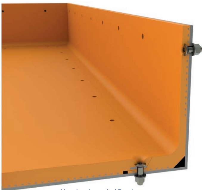
Verschraubung der Vibrorinne